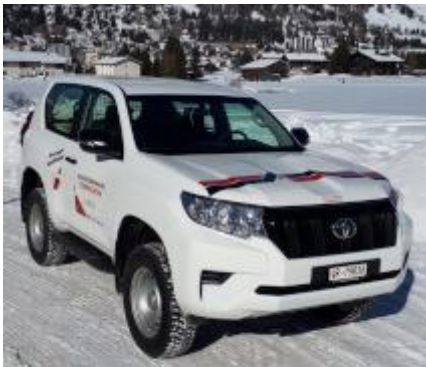
TOYOTA LAND CRUISER

Nutzlast 0.66 to, 7 Plätze, Anhängelast 3.5 to., hochgeländegängiges 4x4 Fahrzeug