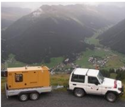
TOYOTA LAND CRUISER

2 Plätze, Nutzlast 1.36 to., Anhängelast 3.5 to., hochgeländegängiges 4x4 Fahrzeug